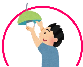
電球・電池の交換

暮らしの中で感じる「ちょっとした困りごと」や「不便と感じる簡単な作業」をお手伝いする事業です。