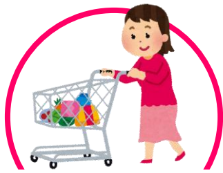
体調不良時の買い物