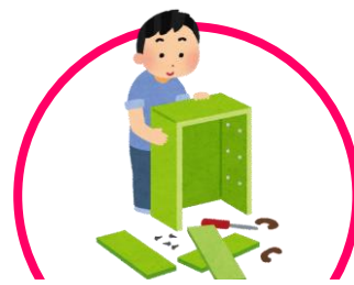
家具の簡単な組み立て