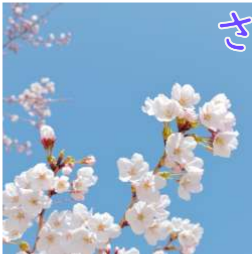
ささえあうまち 我孫子