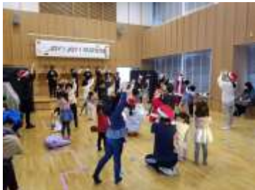
JOY! JOY! クリスマス会

「ハンデのある子もない子もみんな集まれ」をキーワードに行っている子ども向けのお楽しみ会