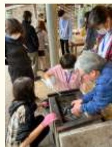
ホップステップふれあいキャンプ