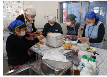
おたのしみ昼食会の調理実習