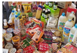
寄付していただいた物品

令和5年度より、新たに事業の名称を「たすけあいバンク我孫子」へ変更。一年を通じて継続的に食品・家庭用品等の寄付の受け入れと困窮世帯への支援を行っていきます。