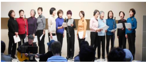
懐かしい歌・みんなで歌いましょう