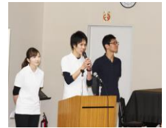
のぼさう健康寿命