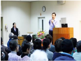
講演「健康脳のまもり方」

平成 28 年 3 月 6 日（日）に、あびこ市民プラザにて開催しました。平和台病院名誉院長・東京慈恵会医科大学名誉教授 阿部俊昭 先生の講演を午前中に行い、午後は踊りや歌等のアトラクション、健康介護相談、パネル展示等を行いました。来場者の方には、勉強にもなり、また楽しいひとときを過ごしていただけたと思います。ご協力くださった関係者の皆様方には、心より感謝申し上げます。