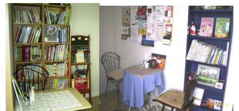
幼児の絵本のある部屋

和・輪・笑い ★今インターネットで情報を検索することが日常となり、大学の図書館の本の貸し出しが激減しているそうです。本を読む学生は、図書館で本をさがすときに関連するものを見つけ、自分の意見を組み立てているが、インターネットで情報を調べている学生は知識は豊富ですが、自分で考えることが出来ないといわれています。★幼児は色々な知識と体験を絵本を通して獲得してゆきます。今までずっと読み継がれてきている絵本には親子の願いが込められているように思います。今回紹介した絵本カフェ DEMI、訪ねてみて下さい。