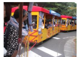
シーサイドトレイン

編集後記 ご近所のコキアの色が緑から赤色に変わってきました。金木犀のいい香りもそろそろ終わりに近づいています。この時期、私たちのメインイベントである「こほく福祉まつり」の準備も大詰めを迎えています。今年も大勢の皆様のお越しをお待ちしております。