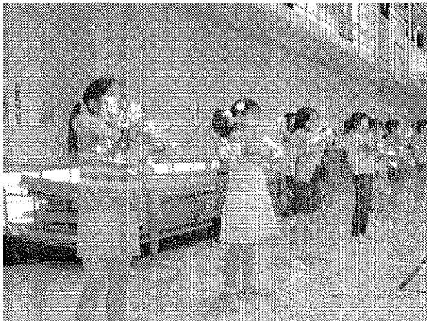
ダンス・カッコいい!