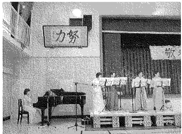
アンサンブルフローラ