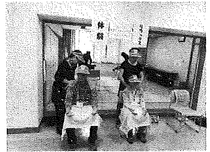
リラクゼーション体験