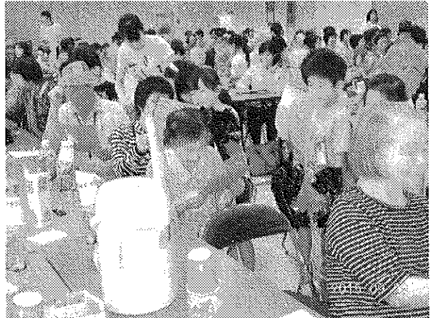
おてがみありがとう