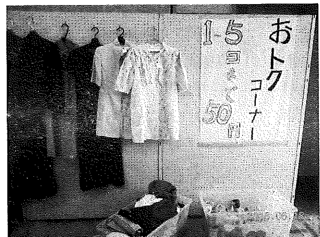
お買い得品コーナー