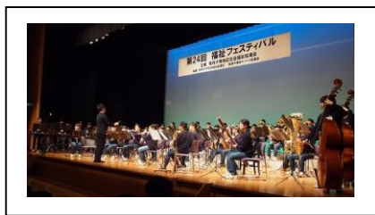
我孫子中学校 吹奏楽部