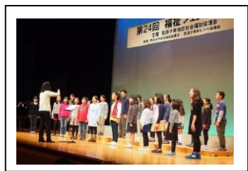
高野山小学校 合唱部