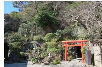
長谷寺弁天堂前の鳥居