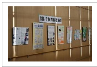
福祉施設の紹介パネル