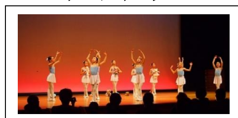
スワン容子バレエ教室