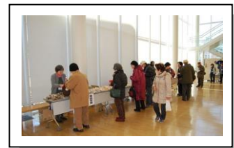
福祉施設の景品と交換