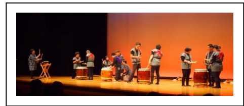
和太鼓サークル「てん」