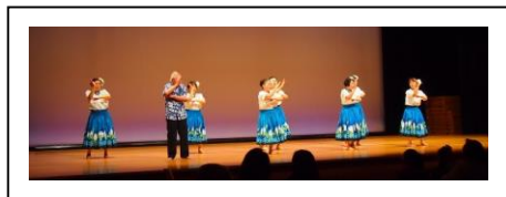
アロハ・フラ・オハナ