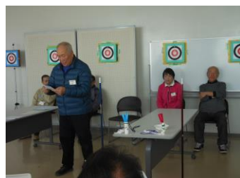
【吹き矢を楽しみました!!】