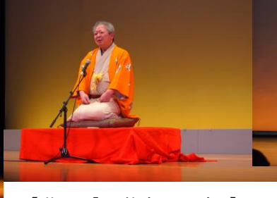
【落語「三遊亭とん楽」】