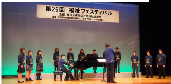
【高校生合唱「ルミエール」】

各町会・自治会の皆様、ご支援ご協力いただきありがとうございました。 会場に足を運んで下さった大勢の皆様と出演くださった方々の心がひとつになり心暖まる楽しい会になりました。会場設置の募金箱にご協力ありがとうございました。