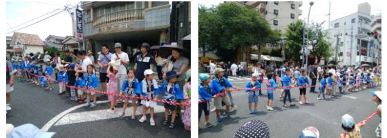
【 八坂神社祭礼 】

今後も、地区社協等の交流会を通じ、他自治会の情報等を活用しながら、より良い住環境の充実を図って行きたいと思っております。皆様、よろしくお祈りいたします。