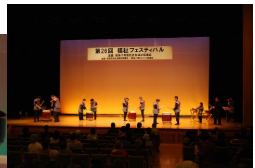
【和太鼓サークル「てん」】