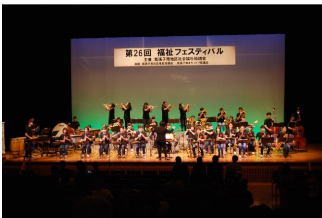
【吹奏楽「白山中学校」】

過日は、福祉フェスティバルへのお招きありがとうございました。子どもたちにとって人前で発表し拍手を頂たり、お声をかけて頂くことがなによりの励みになります。今回は、3月18日の定期演奏会と夏のコンクールに向けて日々の練習に取り組んでおります。また、何か発表の機会がありましたらお声掛け頂ければと思います。当日の写真も同封して頂きありがとうございます。3月の演奏会の際に掲示させていただきます。南地区社会福祉協議会の皆様におかれましてもまだまだ寒い日が続きますのでご身体ご自愛ください。