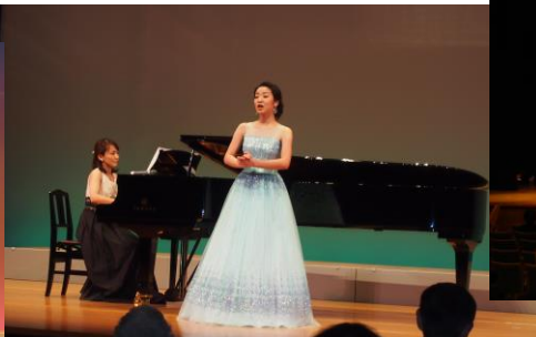
【ソプラノ歌手「塚本江里子」】