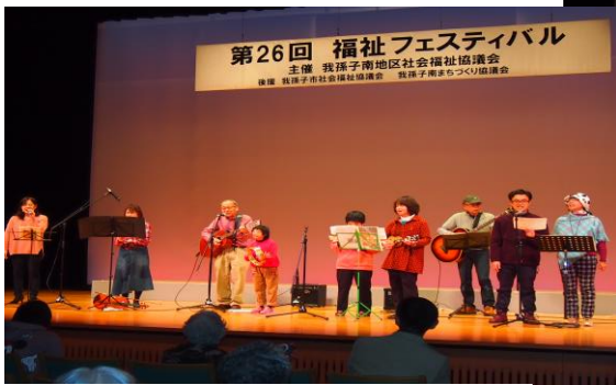
【軽音楽「ホットポットファミリー」】