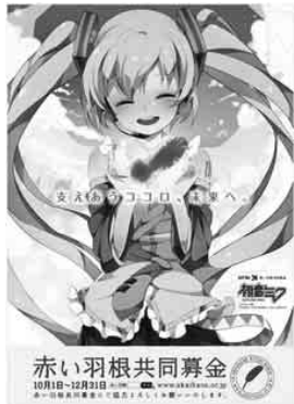
赤い羽根共同募金 10月1日～12月31日

また、「歳末たすけあい募金」は、12月1日から並行して始まります。この募金は、「みんなで温かいお正月を迎えよう」をスローガンに募金活動が行われ、我孫子市内で使われる募金です。皆様からの温かいご支援をお願いします。