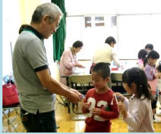
コマの紐のかけ方を教わる児童

コマ、ベーゴマ、おはじき、あやとり、お手玉、折紙、囲碁、将棋など昔の遊びを通して楽しさを伝えて交流をしています。