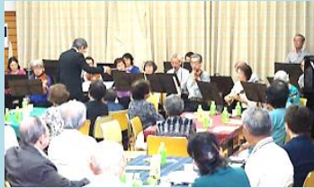
アンサンブルを楽しむ

気軽に参加できるイベントを天王台北・こもれびの両近隣センターで毎年1回開催します。交流を通してお知合いになる仲間づくりを支援します。