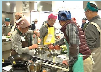
料理のコツを教わる男性軍

高齢化が進む中、男性同士の交流の場として「男の料理教室」を、天王台北・こもれびの両近隣センターで毎年1回開催しています。