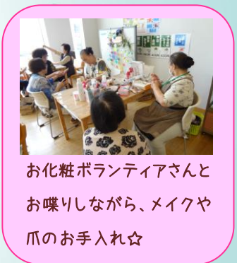
お化粧品ボランティアさんとお喋りしながら、メイクや爪のお手入れ☆