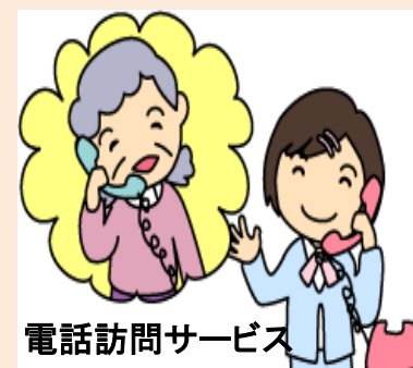
電話訪問サービス