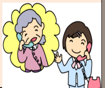
電話訪問サービス